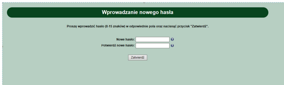
Rys. 2. Wprowadzanie nowego hasła

Wyświetlona zostaje strona „Wprowadzanie nowego hasła” (Rys. 2)